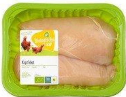
Biologische kipfilet € 27,99 per kg