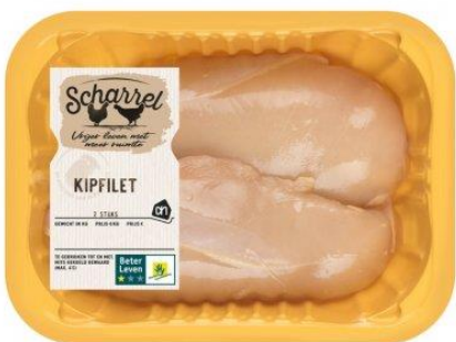
Scharrel kipfilet (400 gr) € 5,76 € 14.40 per kg