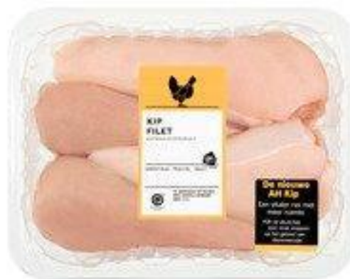
Kipfilet (200 gr) € 11,50 per kg Kipfilet naturel € 8,60 per kg Kiloverpakking € 7,50 per kg